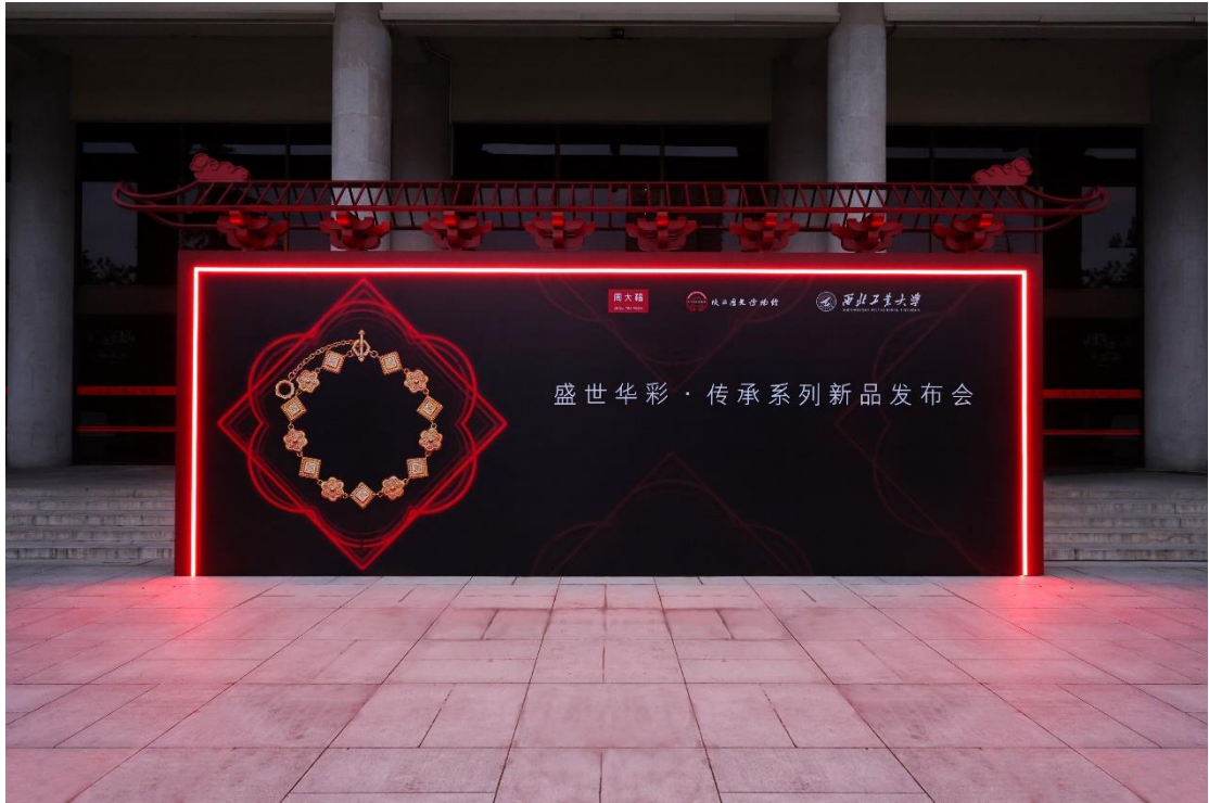
周大福盛世華彩·傳承系列新品發佈會