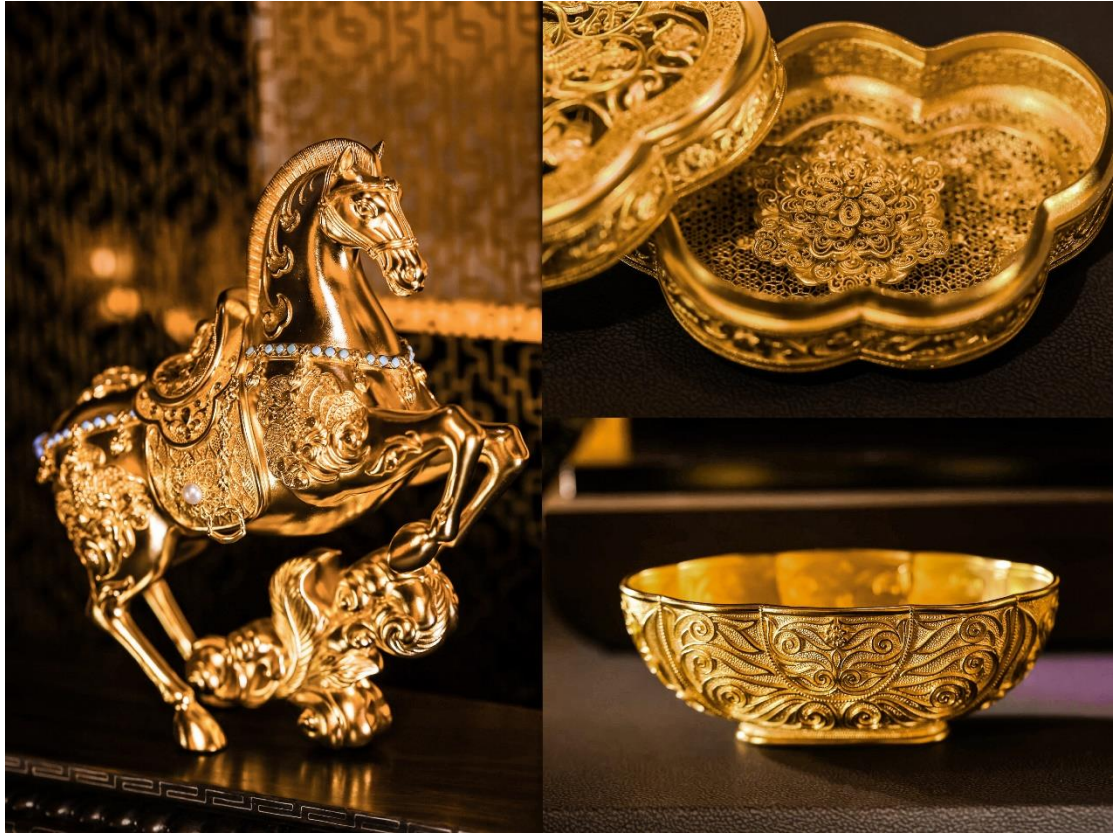
盛世華彩·傳承系列新品展示

其中，盛世華彩·傳承系列的華星凝輝手鏈運用傳統黃金鑄造工藝，以陝西歷史博物館館藏團花鎏金銅帶板、白玉蹀躞帶銙、孔雀紋銀方盒為設計元素。方形為白玉蹀躞帶銙外形，飾以孔雀紋銀方盒為原型的忍冬四出花，間飾以團花鎏金銅帶板為元素，花蕊以細小的金粟點綴。團花間以四出忍冬紋菱形珠，寓意花開不斷四時春，榮華不斷年年福，再現了大唐黃金藝術的輝煌，也寄託著華星凝輝、福祿長久的美好祝願。