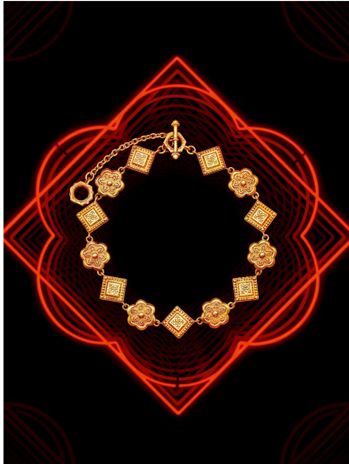
盛世华彩·传承系列华星凝辉手链