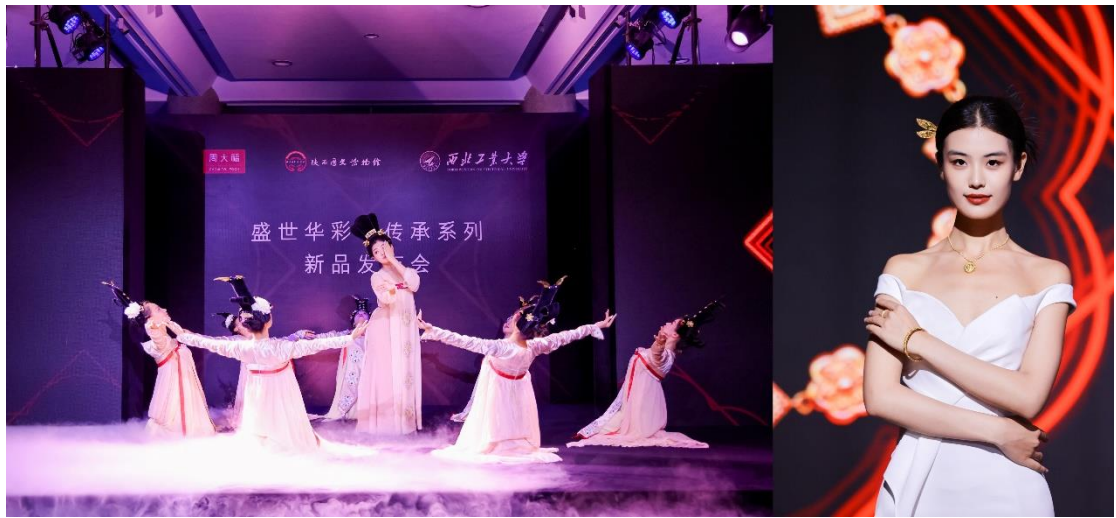
周大福盛世华彩·传承系列发布会活动现场图

此次合作，贯彻了周大福传承优秀传统文化的坚定信念，亦开启其在珠宝领域多方合作共赢的行业新篇章。盛世华彩·传承系列新品的发布更是凝聚了三方努力的精华之