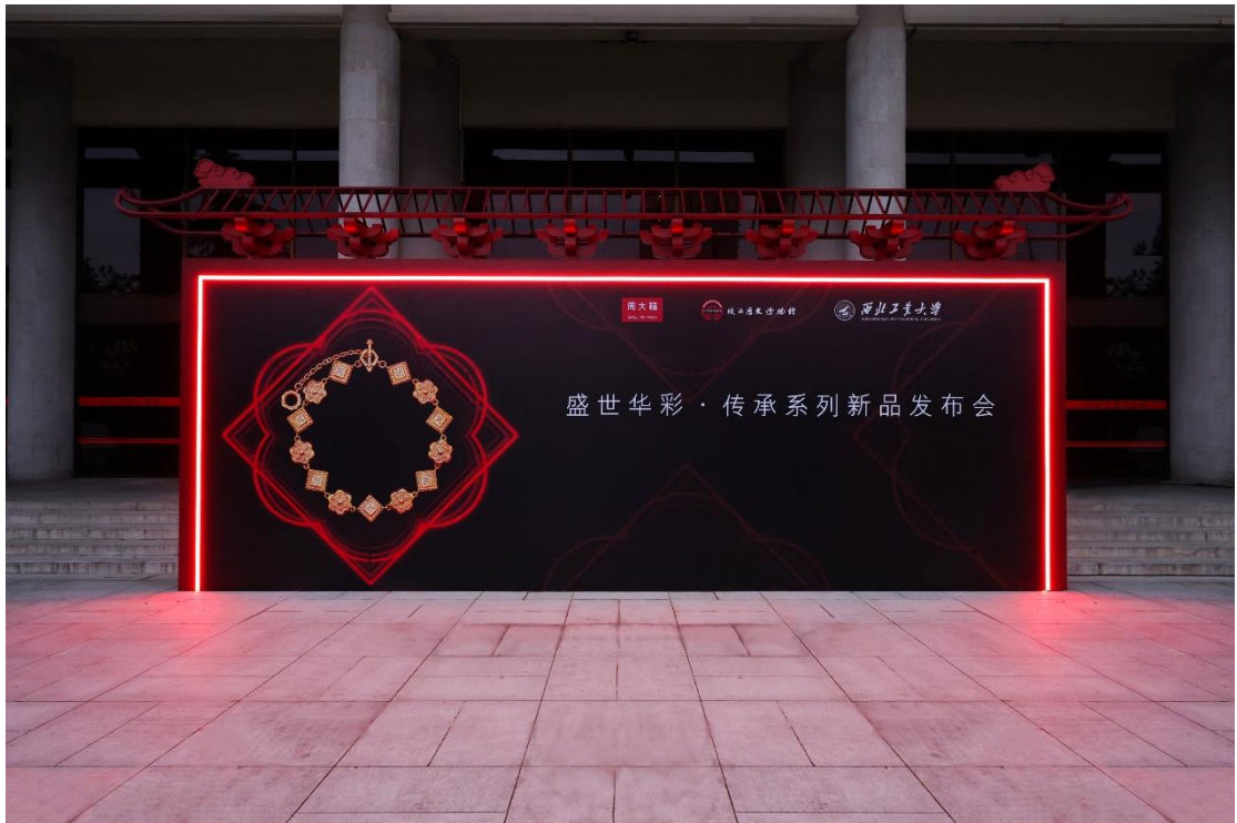
周大福盛世华彩·传承系列新品发布会