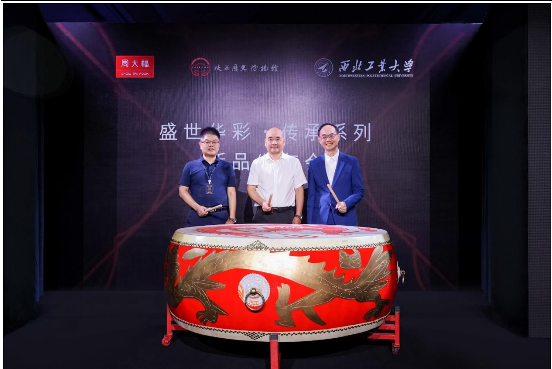
周大福盛世华彩·传承系列启动仪式