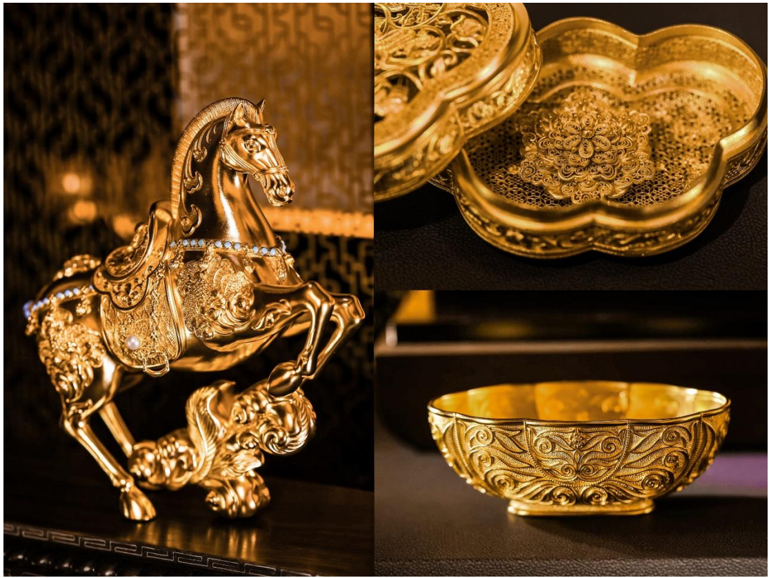
盛世华彩·传承系列新品展示

其中，盛世华彩·传承系列的华星凝辉手链运用传统黄金铸造工艺，以陕西历史博物馆馆藏团花鎏金铜带板、白玉蹀躞带跨、孔雀纹银方盒为设计元素。方形为白玉蹀躞带跨外形，饰以孔雀纹银方盒为原型的忍冬四出花，间饰以团花鎏金铜带板为元素，花蕊以细小的金粟点缀。团花间以四出忍冬纹菱形珠，寓意花开不断四时春，荣华不断年年福，再现了大唐黄金艺术的辉煌，也寄托着华星凝辉、福禄长久的美好祝愿。