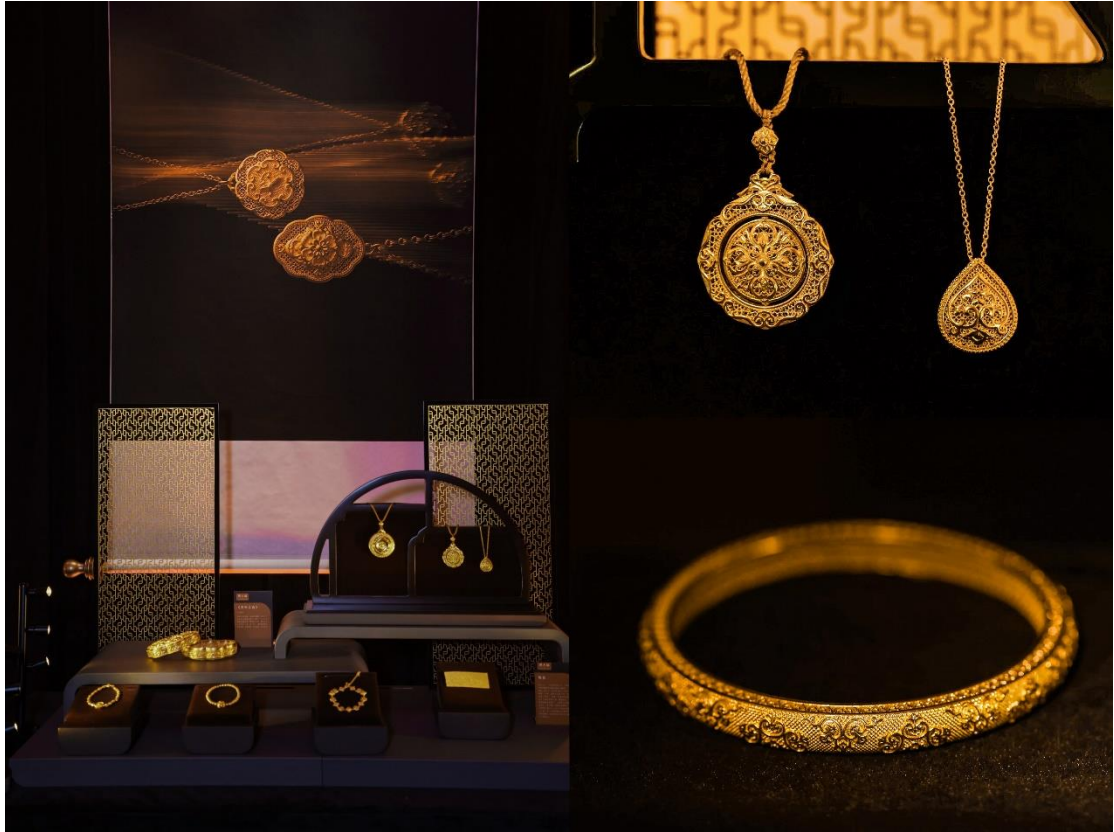
周大福盛世华彩·传承系列新品展示

在工艺制作上，新系列也有着独到之处。在延续使用中国传统黄金工艺的基础上，盛世华彩·传承系列着重展现了镌刻、珠化、金筐宝钿等精湛的唐代典型金银器工艺。该系列的多件产品以镌刻鱼子地纹样为饰，在制作时需要工匠以独到的技艺在金银器表面用錾子雕刻出大小相若、整齐有序、疏密有度的细密圆圈，历经十余道工序才能制成一件造型繁复立体、纹样细密的镌刻作品。这些精巧的装饰纹样，使得新系列产品在秉承周大福精湛技艺基础上，又富有鲜明的唐代艺术文化特色，彰显盛唐时代的独特风韵。